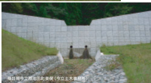
福井県今立郡池田町東俣(今立土木事務所)