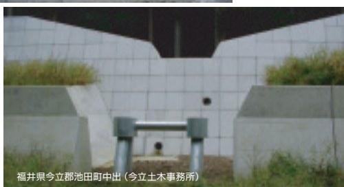
福井県今立郡池田町中出(今立土木事務所)