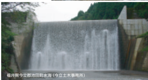
福井県今立郡池田町水海(今立土木事務所)